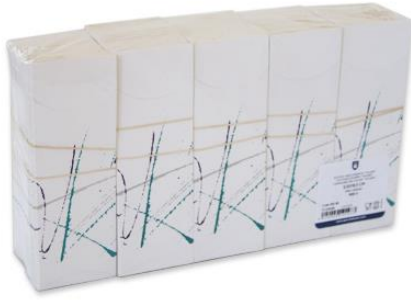
Imagen de paquete